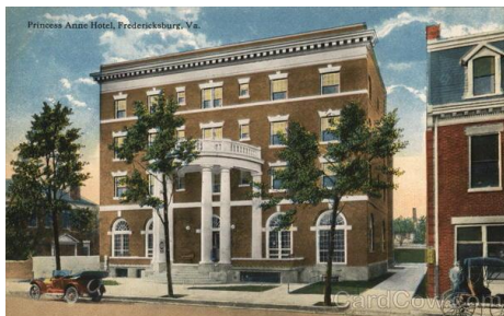
The Princess Anne Hotel